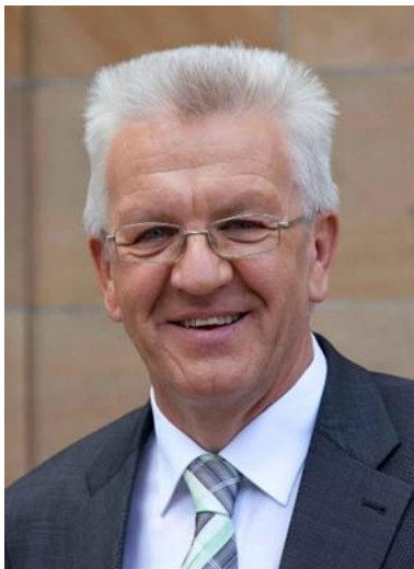
Schirmherr Winfried Kretschmann

Holzhäuser sind echte Klimaschützer. Quelle: VHI